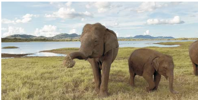
Sri Lankas Nationalparke bewahren ein Paradies mit einer Vielzahl an Tieren und einer außergewöhnlichen Pflanzenwelt (oben Horton Plain unten Minneriya)

Titelbild: Buddhas vor einer Dagoba aus dem 1. Jh. v. Chr. in der Königsstadt Anuradhapura